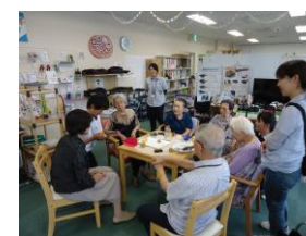
福祉ショールームを散策

散策外出 …機能訓練の一環として屋外散策に取り組んでおります。季節に合わせた公園や美術館・資料館等以外にも図書館散策も行っております。