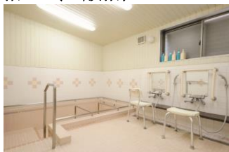
特浴もあり車椅子対応可能