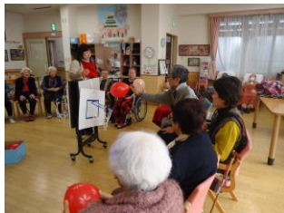
ゲーム感覚で集団運動