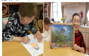
塗り絵や間違い探し パズル等

食事 …当施設内で作り、暖かい食事を提供しています。様々な好み・形態に対応する事が可能です。