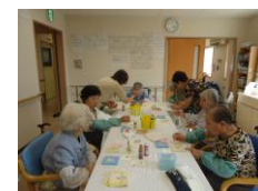
クラフト作品作り

趣味的活動 …書道・カラオケ・ミュージックラボ・園芸・切り絵・折り紙・ちぎり絵・百人一首・手芸・読み聞かせ等 囲碁・将棋・麻雀 等