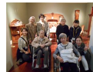
ヤマザキマザック美術館 まで散策

「フラダンス教室」 …地域活動・機能訓練の一環として、地域の方と共に楽しく歌いながら体を動かす機会を持っています。